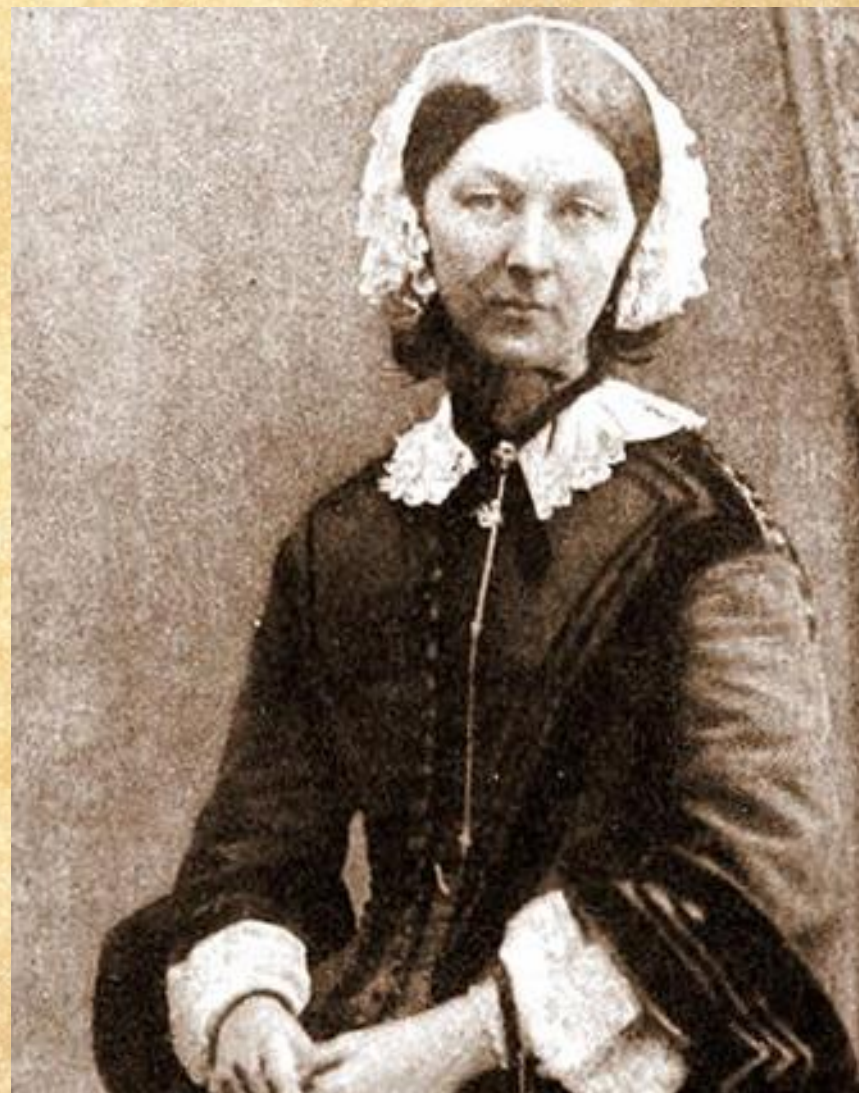
Флоренс Найтінгейл – “Леді з лампою”