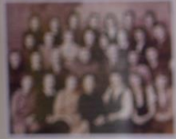
Три роки викладачі факультету працювали в 7 військ. в. Дніпропетровська 1942 р.