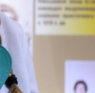
Три роки викладачі факультету працювали в 7 військ. в. Дніпропетровська 1942 р.