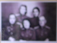
Три роки викладачі факультету працювали в 7 військ. в. Дніпропетровська 1942 р.