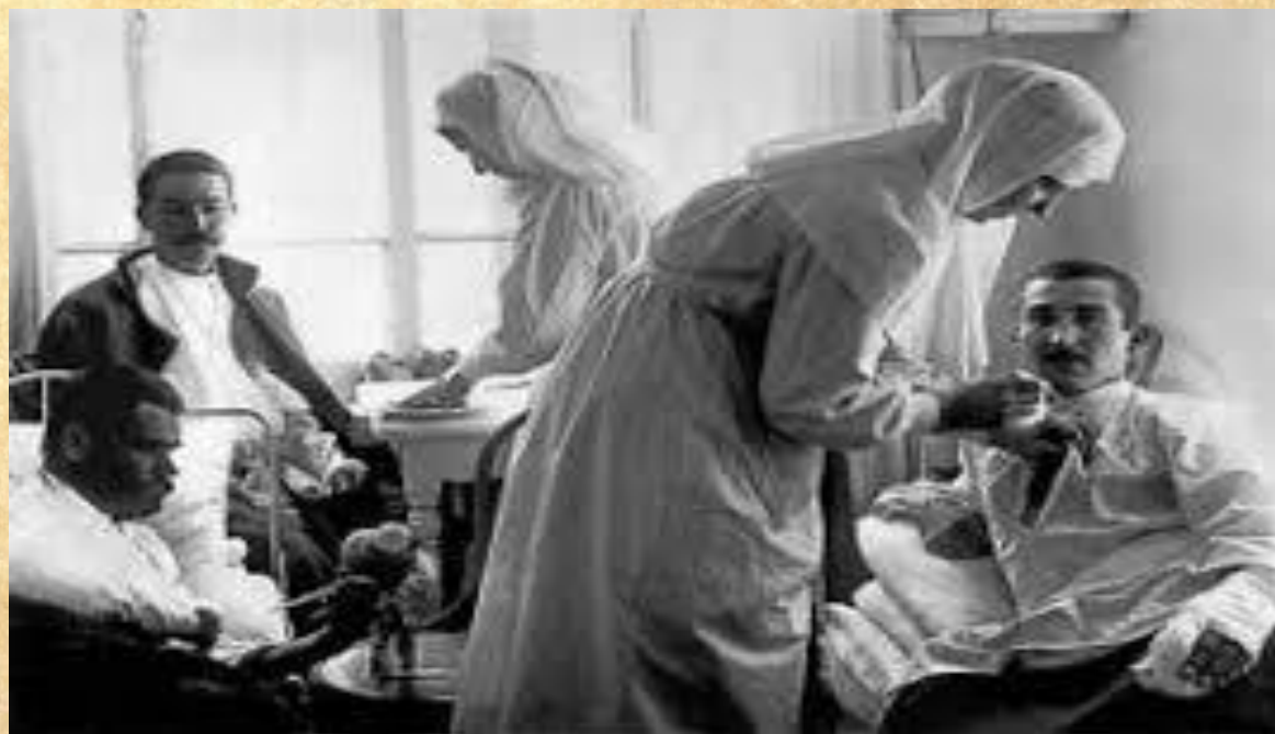
Катерина Бакуніна – сестра милосердя Російської імперії