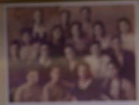
Три роки викладачі факультету медичної школи працювали в 7 військ. в. Дніпропетровська 1942 р.