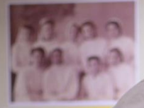
Три роки викладачі факультету працювали в 7 військ. в. Дніпропетровська 1942 р.