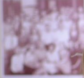
Три роки викладачі факультету працювали в 7 військ. в. Дніпропетровська 1942 р.