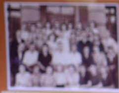
Три роки викладачі факультету працювали в 7 військ. в. Дніпропетровська 1942 р.