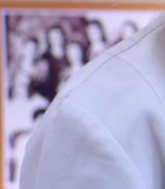
Три роки викладачі факультету працювали в 7 військ. в. Дніпропетровська 1942 р.